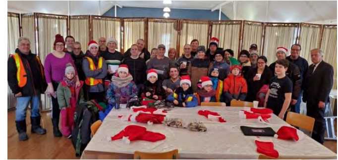
«--- Le souper de Noël des Jeunes de l'école l'Astral de St-Sylvestre.